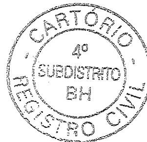
Rosa Helena Rodrigues Costa OFICIAL SUBSTITUTA

Cod.(7802-2) - Emolumento:32.11 + Recome:1.93 + TFG:6.87 + ISSQN:1.61 = Total:42.52